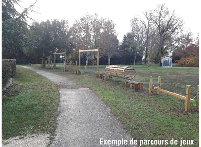
Exemple de parcours de jeux

Le premier est la mise en place de jeux pour enfants. Cet aménagement va se faire sous la forme d'un parcours de 42 mètres de longueur qui enchaîne 8 ateliers séparés chacun par une série de « pas de géants ». Accessibles aux enfants de 3 à 12 ans, c'est l'occasion pour eux de se lancer le défi de réaliser le parcours entier sans mettre le pied au sol. Et on sait que c'est une chose qu'ils aiment tout particulièrement !